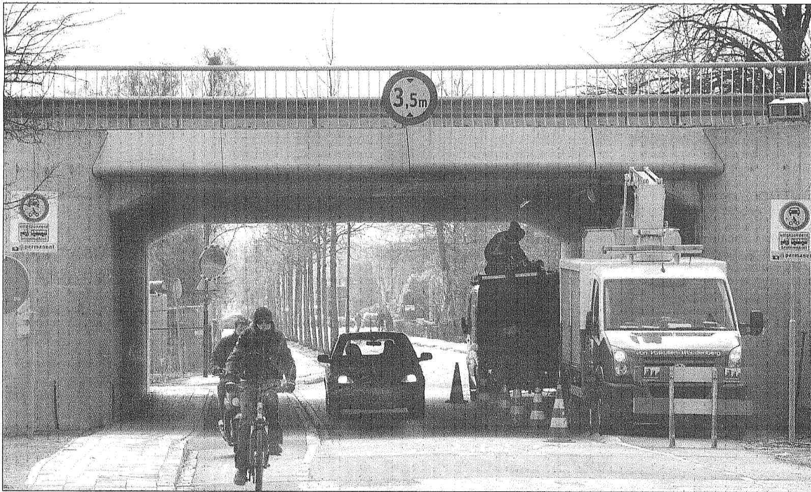
■ Een auto passeert het voor autoverkeer verboden viaduct onder de A12 in De Klomp. Dagelijks gebruiken nog altijd vele tientallen automobilisten de tunnel die alleen nog open is voor bussen en fietsers. foto Herman Stöver

Zie ook pagina 30 Fris nieuw huis in vier maanden