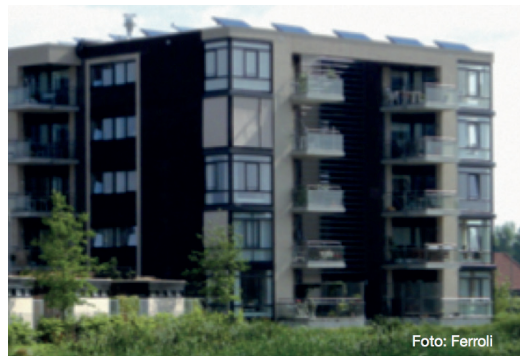
Hoogbouwsysteem op appartementsgebouw